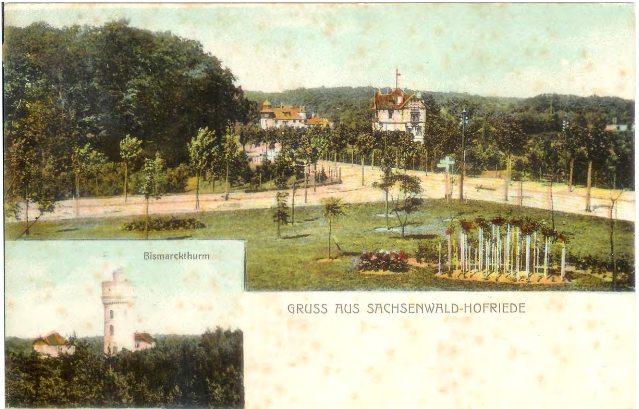
Ansichtskarte postalisch gelaufen 1902, Einmündung Hofriedeallee in die Bismarckallee Blick auf den Forsthof und die Villa Specht

Die Hofriedeallee hatte ursprünglich – wie alle von Emil-Specht angelegten Alleen - auf beiden Seiten die Straßenbäume. Inzwischen sind alle Bäume auf der Südseite verschwunden.