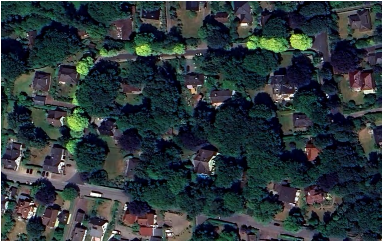
Google earth Luftbild vom 3. Juni 2023