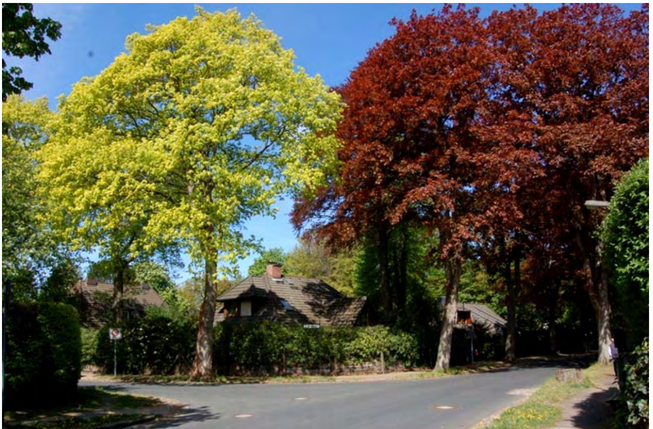
Zitronenahorn in der Hofriedeallee