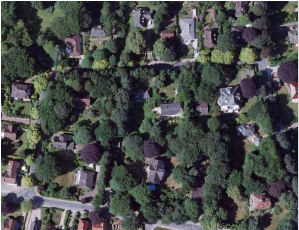
Hofriedeallee aus der Luft (August 2006,) Deutlich sind die Lücken und die nach gepflanzten panaschierten Ahorne (kleine Bäume) zu sehen